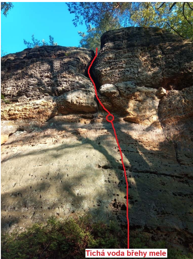
Tichá voda břehy mele

Stěnou ke kruhu. Přes převis do komína a jím n.t.