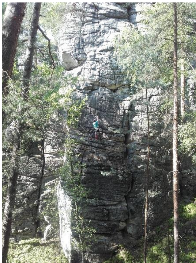
osazování 1. kruhu

8. Popis cesty (náskres): Podél levé hrany (smyčky) přes ukloněný žlábek vpravo k 1. kruhu. Přímo, později mírně vpravo po krachlích (smyčky) ke 2. kruhu. Policemi přímo na temeno.