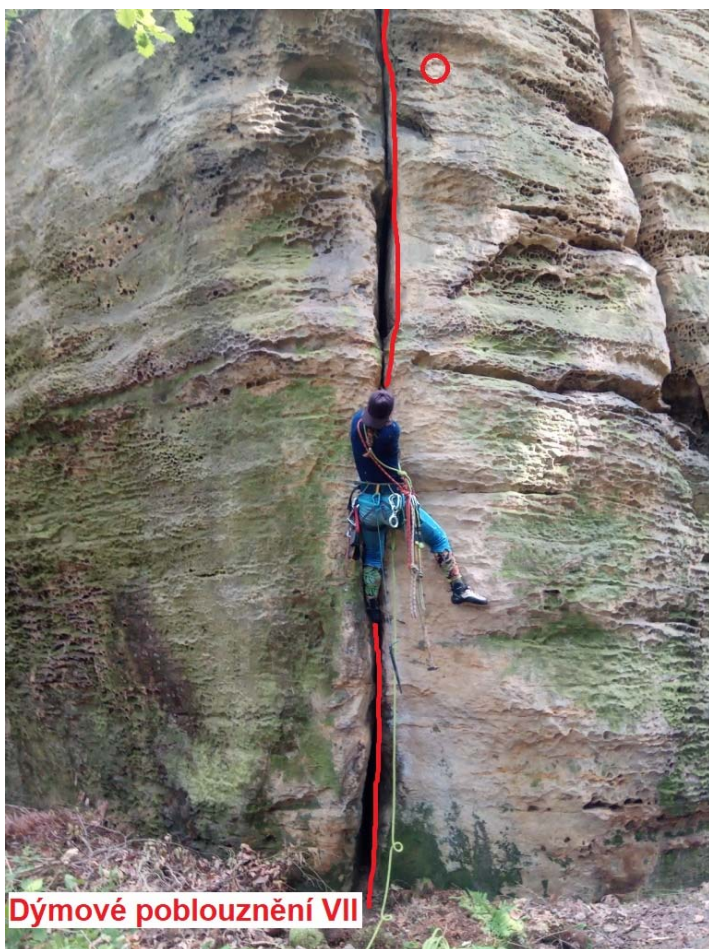
Dýmové poblouznění VII

Spárou v levé části masivu přes kruh na balkón (slanění).