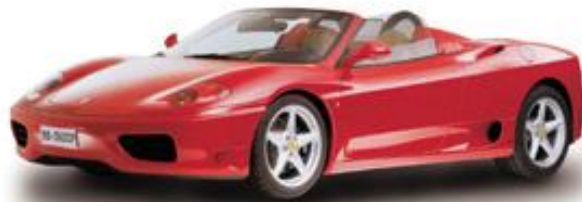
(Na ilustračním snímku kabriolet ve verzi Ferrari 360 Spider)