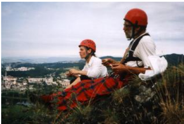
(Na vrcholu)

Toliko alespoň zkráceně z druhé půle prázdnin. Jako vždy najdete o některých akcích více v listě.