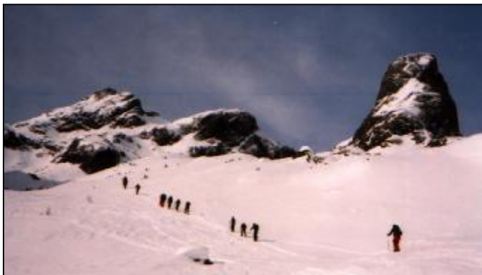
Výstup ledovcovým kotlem na Hochkö nig.

Ve středu ráno jsme vyrazili na Hochkö nig (2941m).