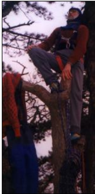
Na snímku autor cesty na pověstném „TOTEMU“

Několik vylezených cest v okolí Ďáblovy kazatelny korunoval prvovýstup Totemová cesta pěknou spárou v pravé části Stěny u Ďáblovy kazatelny.