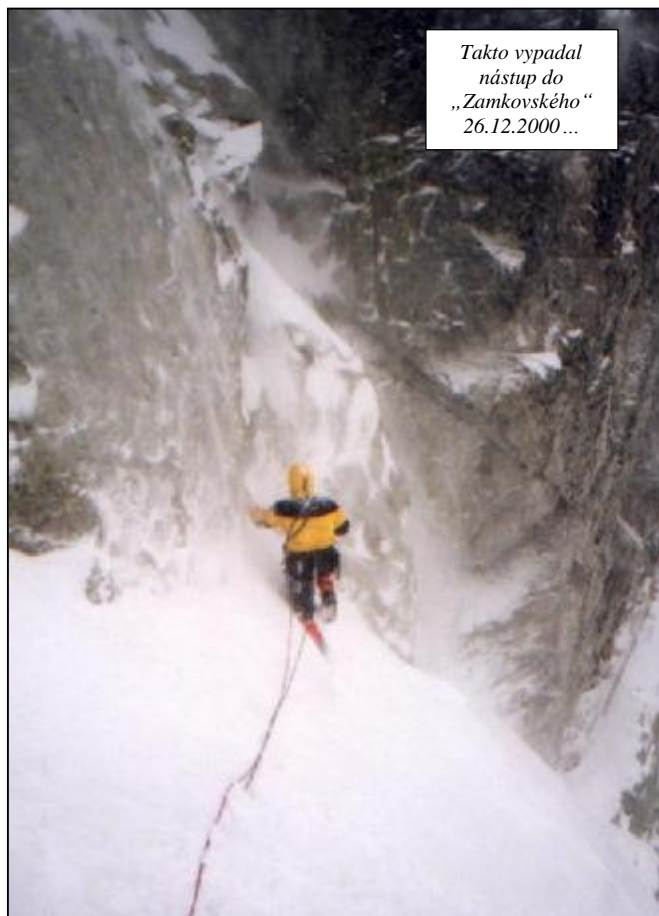
Takto vypadal nástup do „Zamkovského“ 26.12.2000...