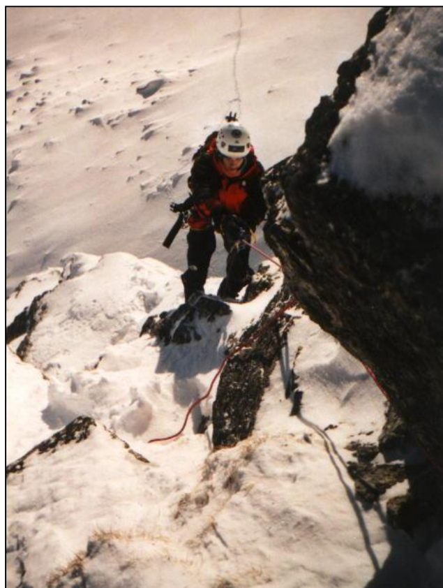
Je krásné počasí a my začínáme jumarovat první délky v Zamkovském...

Teplota je -10°C a hvězdy závodí s Měsícem o to, kdo osvítl větší plochu. Na cestu nemusíme ani svítit. Jen občas, když je cesta hodně zafoukaná a neznatelná. Za zády se nám objevuje nejdříve takové jemné růžovo, které se později později stává stále intenzivnější. Nakonec je z toho překrásný východ slunce. Zase se ujišťuji o tom, proč ti blázniví lidé po těch horách lezou. Je to krása. V půl sedmé jsme pod stěnou a v sedm začínáme jumarovat po fixech. To nás docela zahřeje.