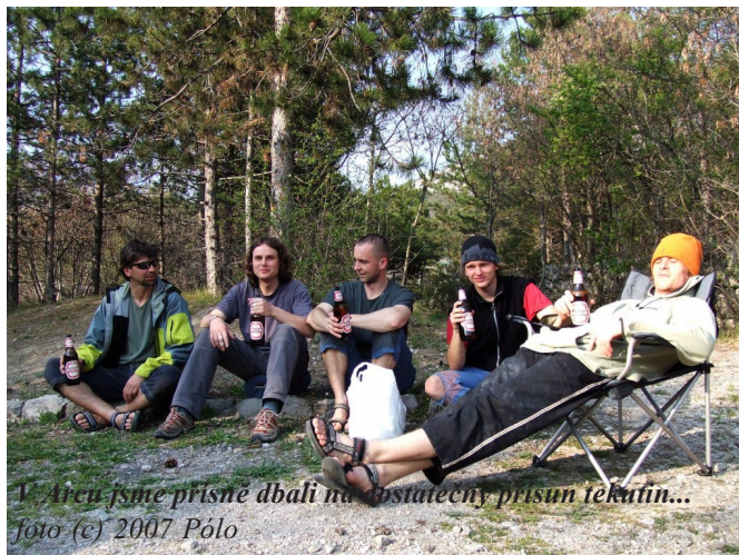
V Arcu jsme přísně dbali na dostatečný přísun tekutin...

nejsportovnější a nejtvrďší oblasti v okolí Arca. Jo, je to Massone se svými dlouhými převislými cestami, se čtyřicetimetrou Pietrou Muratou za 10+ a s legendárním Undergroundem za 11, jehož skalp si z Massonské umělé jeskyně odnesl i náš Tomáš Mrázek.