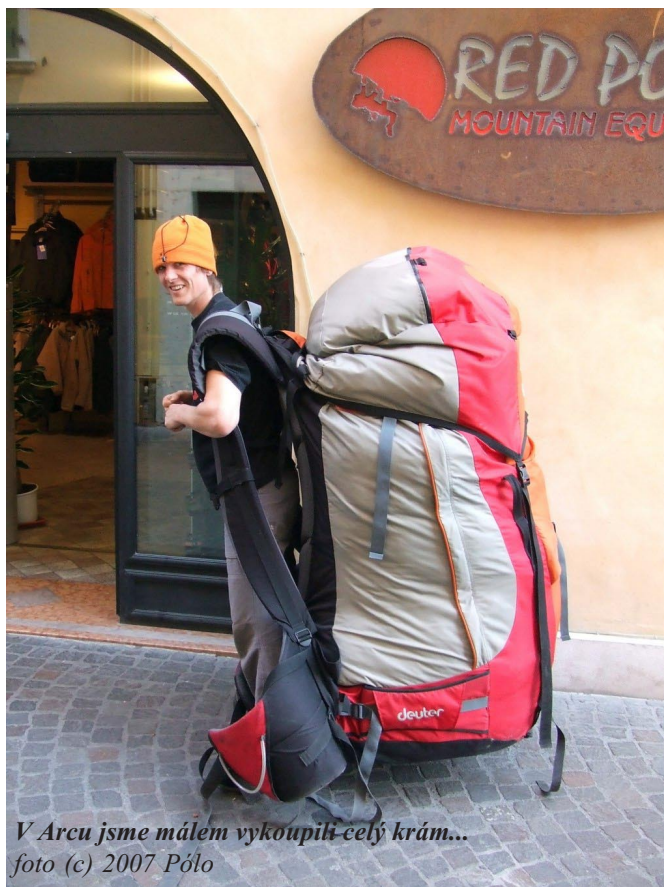
V Arcu jsme málem vykoupiili celý krám...