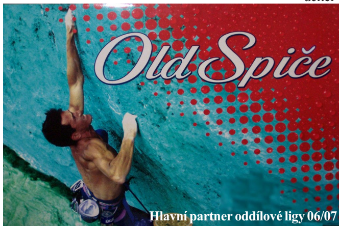
Hlavní partner oddílové ligy 06/07