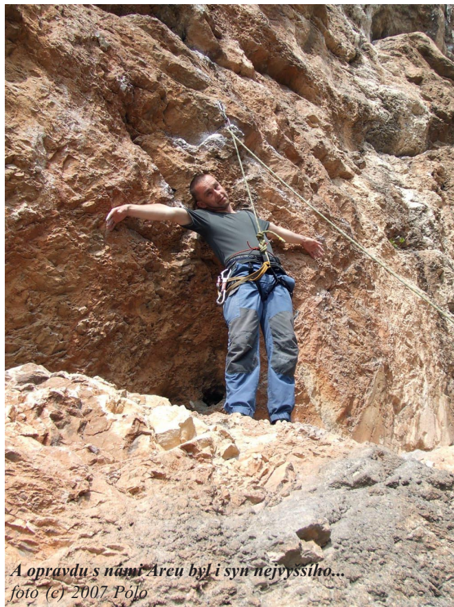
A opravdu s námi Arcu byl i syn nejvyššího...

V sobotu se do této bombastické oblasti vypraví jen učitel, Pólo a Kuba, protože Masi se rozhodl, že se nechá Radkem vytáhnout nějakým vícedélkovým 6a+ na Mt. Colodri. No a je to docela zajímavě strávený den. Nejdřív o fous unikneme policajtům před pokutou (po tom, co uzavřeli olivový háj a už se v něm nedá parkovat, je v Massone místa pro parking vážně málo) a pak si s nima vyměnili na parkovišti přímo pod stěnou místo (to zařídil Pólo – prostě tu policajtku okouzлил svým úsměvem a ona mu svým autem vycouvala a já najel na její místo - nádherná souhra). Protože jsme z toho včerejšího těžkého onsajtování utahání, lezeme málo. Trochu blbnem na slacku. Nejvíce o našem sobotním snažení snad vypoví Pólovo denní skóre. Dal jeden a půl cesty (rozuměj 3 půlky). Únavu, hlad a žízeň jdeme zahnat do picírky v centru Arca. Fajný konec dne. Večer na San Siro přijíždí