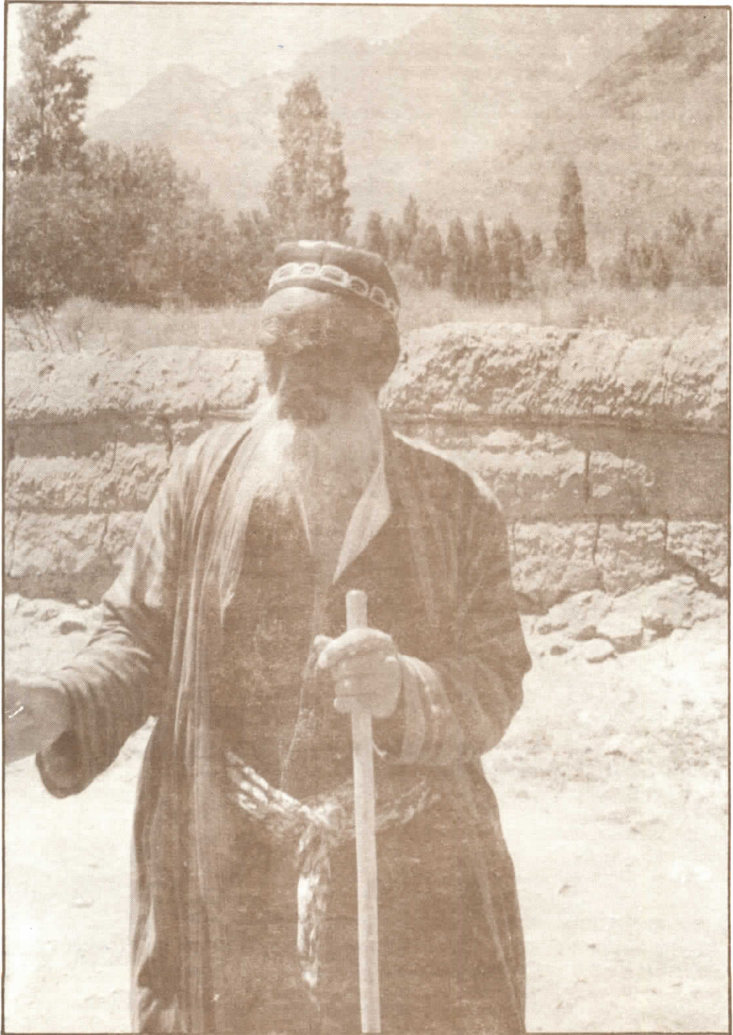
Tadžik z Džirgitalu