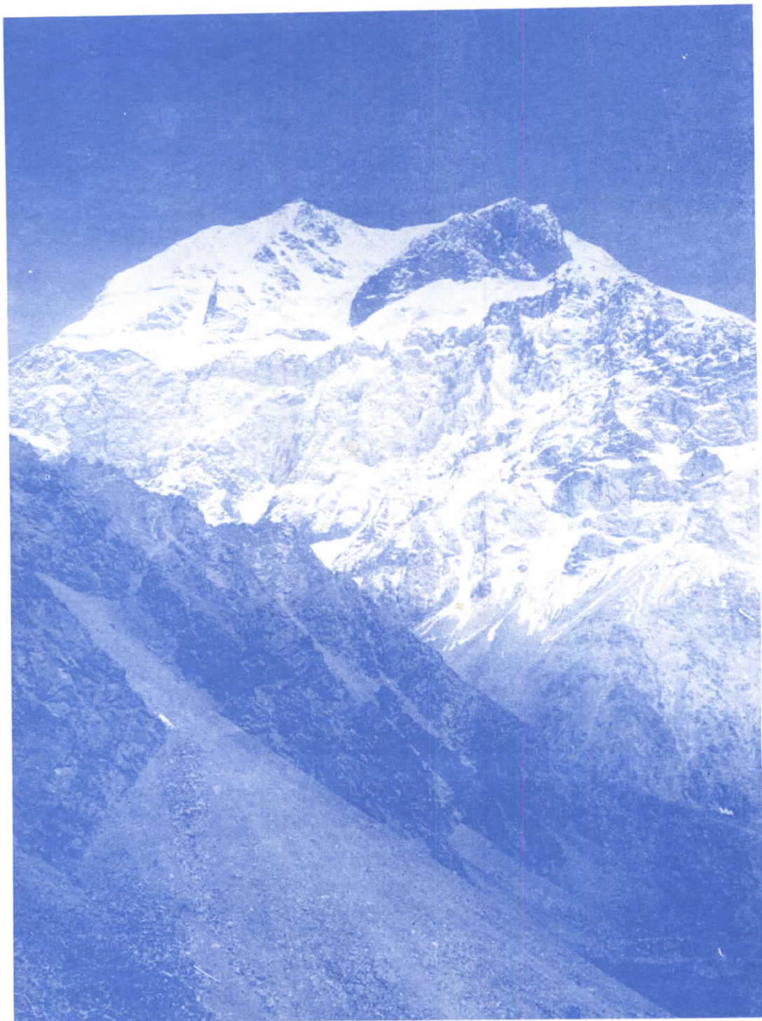
Pik Korženěvské - 7105 m