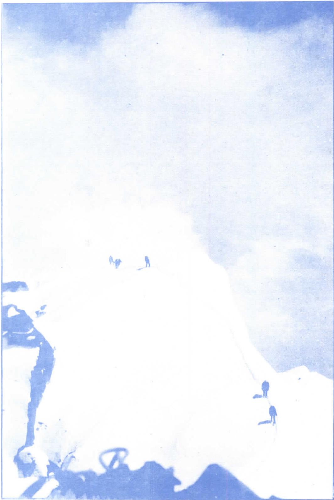
Poslední výšvih před vrcholem