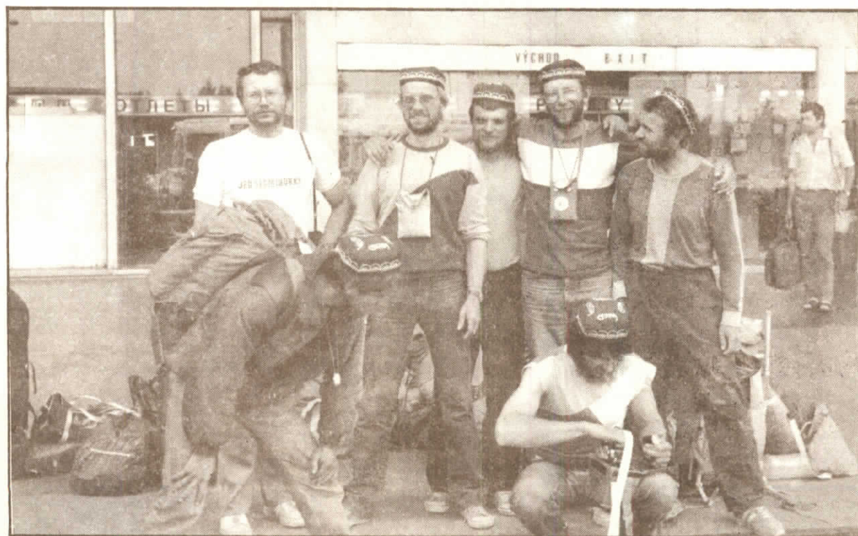
Po návratu na Ruzyňském letišti