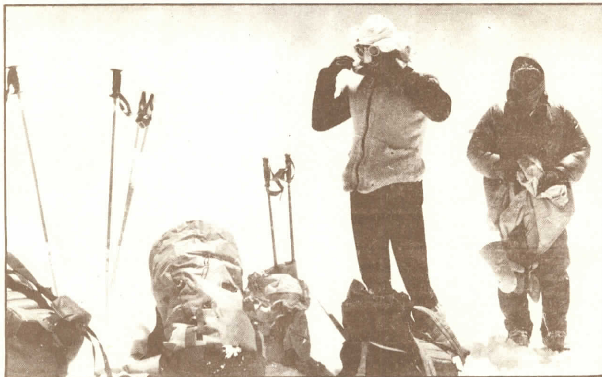
Nad posledním táborem, v pozadí Pik Komunismu