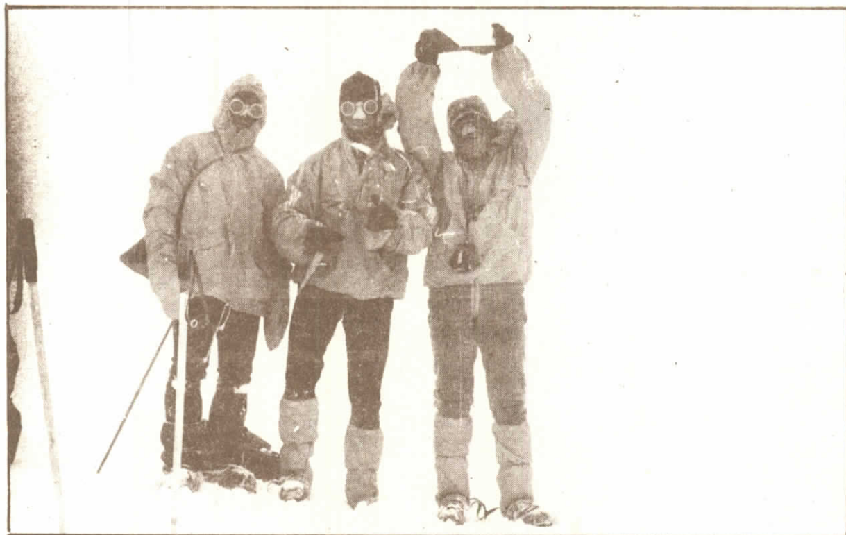
Na vrcholu Piku horženěvske 1105 m