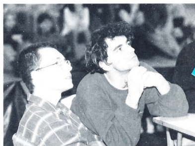
Je to sekané, ale je to bomba