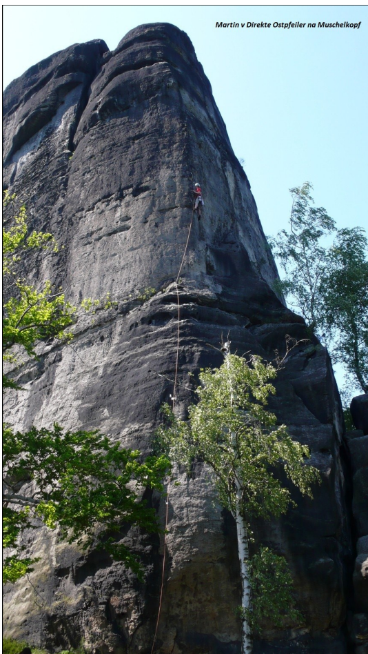
Martin v Direkte Ostpfeiler na Muschelkopf

v roce 1948. Pokud vám to jméno nic neříká, tak tento člověk vylezl v roce 1953 sólo Severní stěnu Cima grande a SZ stěnu Civetty, ve stejném roce zemřel v severní stěně Eigeru. Ač-koiv má cesta v názvu hranu, nastupuje se přes převis vpravo od hrany a obloukem vede ke kruhu zhruba v polovině stěny. Od něj se leze šikmo vlevo, stále mírně do kopce po krachlích až na velkou polici, kde je dodaný druhý kruh (borci tu asi kdysi stáli a stavěli z čisté pozice!!!). Docela vytrvalostní úsek, dost dobře ne-