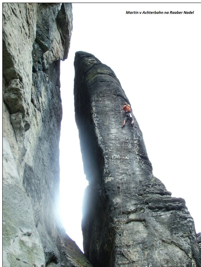
Martin v Achterbahn na Raaber Nadel