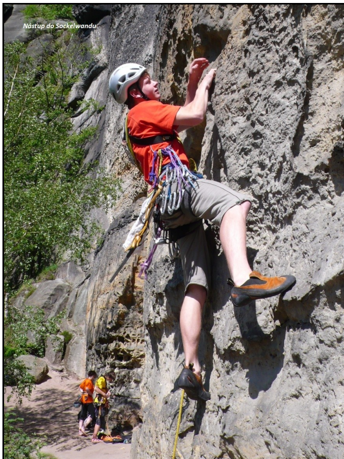
Nástup do Sockelwandu