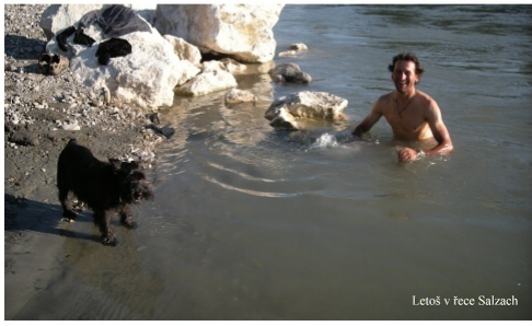
Letoš v řece Salzach

18. 8. 2011 Čeká nás krásný den a vrchařská prémie. Nastoupáme na Bischofswiessen a můžeme vidět rodinku Watzmannů v celé své kráse. Zleva máma, dětičky a táta Watzmann, náš cíl. Po sjezdu na B20 opět mírně stoupáme ve směru Ramsau. Po několika kilometrech ve Wimbachtalu v Wimbachbrücke/ Wimbachklamm končí naše cykloetapa, celkem dnes 30km. Bagrujeme guláš a polívku, koupeme se k podivu turistů v horské řece. Schováme kola mezi nařezané špalky, zajistíme proti dešti a můžeme vyrazit na Watzmannhaus (1930m). Čeká nás asi 1300 m převýšení, přičemž