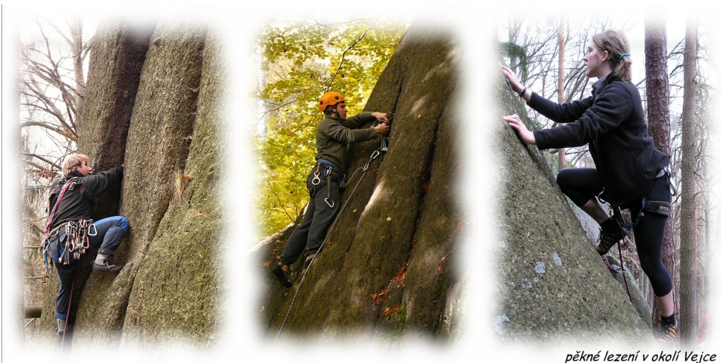
pěkné lezení v okolí Vejce

Zmapování této oblasti se podařilo v podstatě díky znovupřezení většiny cest partou lezců kolem Pavouka z Varů. Jak už bylo řečeno, původ cest je neznámý. Proto byly názvy skal a cest včetně klasifikace navrženy při prvních opakovaných přeletech. Během mapování se urodilo i něco málo nových kvaků (bouldrů), o kterých se jen můžeme domnívat, že jsou nové.