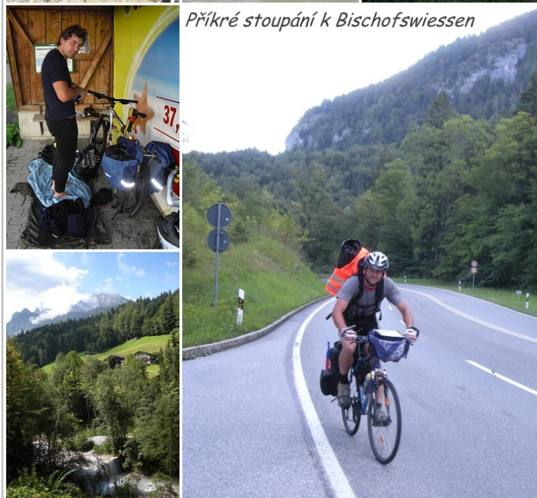
Příkré stoupání k Bischofswiessen