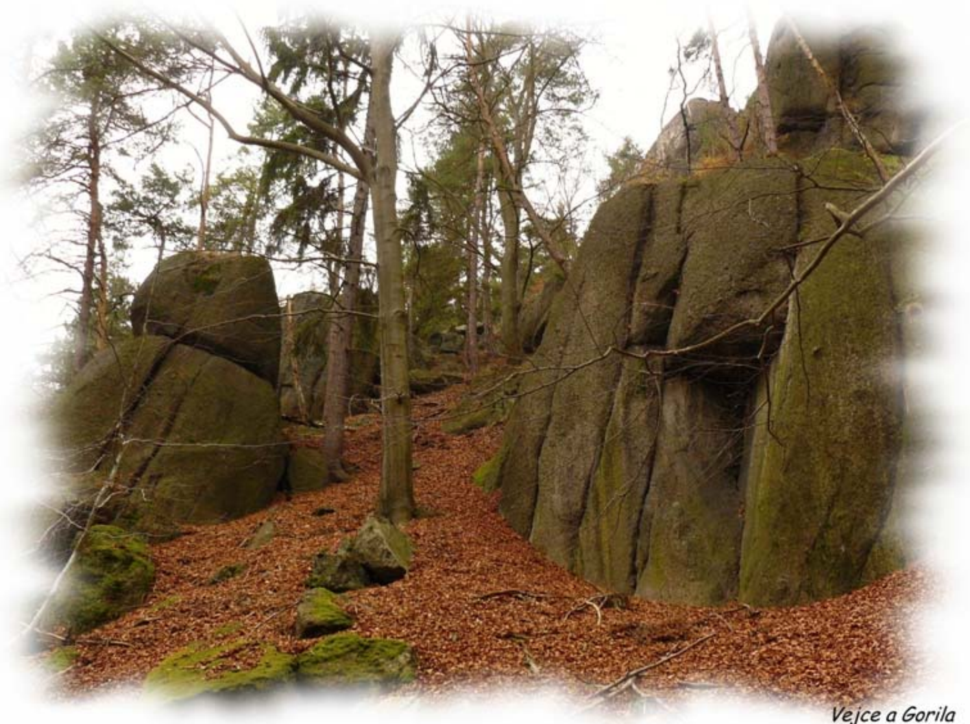
Vejce a Gorila

Skalní masívy ční z prudkého svahu a jsou orientovány na jih. Najdou se tu i dvě nevysoké věže, na kterých jsme osadili vrcholovou knížku. Charakter lezení je patrný již z fotografie – oblá, hrubozrnná žula poskytuje vyžití zejména v „krystalových“ plotnách. I když „kousavé“ spáry mají také určitě svou skupinu vyznavačů. Jistým handicapem je fakt, že je skála místy docela drolivá, případně zarostlá mechem a lišejníkem. To ovšem pravověrným krušnohorským kvakerům nikterak nevadí!