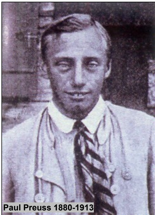
Paul Preuss 1880-1913

zdraví dole a můžeme si podat ruku na znamení ukončeného výstupu. Na nebi jsou všude kolem temné mraky, ale zatím se nám vyhýbají. K autu se tedy můžeme vrátit oklikou – volíme cestu, vedoucí pod severními stěnami. Opět si vychutnávám ty nádherné pohledy a vzpomínám, jak jsme kdysi lezli Comiciho. Mraky jsou ale najednou nějak blízko a začíná kapat a tak raději přidáváme do kroku. Bouřka nás naštěstí minula a k autu přicházíme skoro suchí.