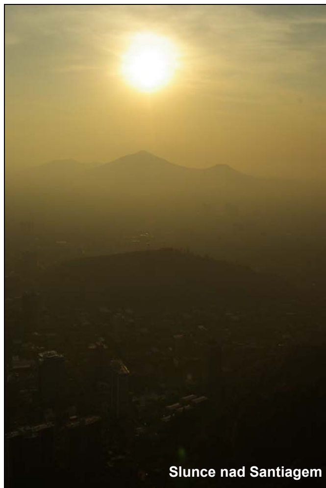
Slunce nad Santiagem