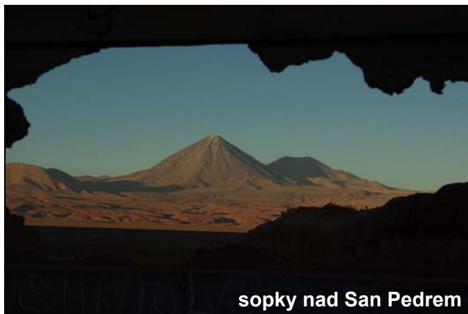
sopky nad San Pedrem

Escondia, taktéž ležící v poušti Atacama. Nicméně zůstává dolem se zdaleka největší produkcí s průměrně 29 milióny tunami vytěžené mědi do roku 2007. Chile je tak zodpovědná za více jak třetinu světové produkce tohoto kovu.