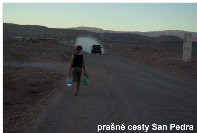
prašné cesty San Pedro

V celku odpočatí z pohodlného autobusu kráčíme prašnými ulicemi pouštního města Calama. Ano, prašnými ulicemi. Konečně sucho a teplo!