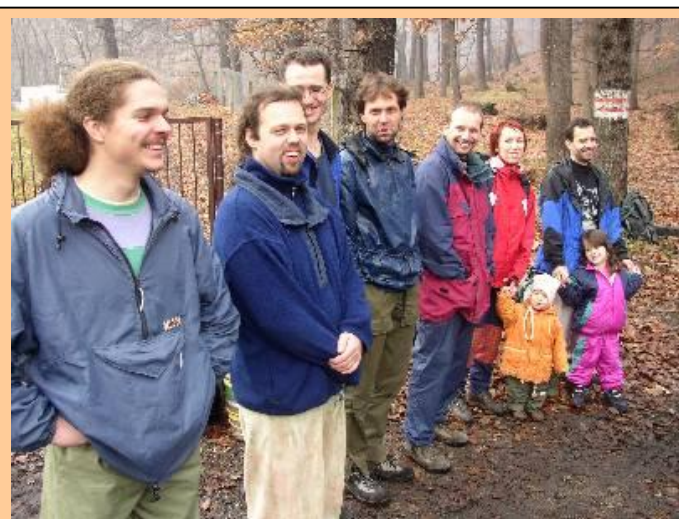
BALTAZAR CUP 2002 – Účastníci ...

organizačních zádrhelů, že jsem si musel v cizím pokoji ukrást peřinu a že majitelka hotelu v podstatě uzavřela kuchyni, vše probíhalo hladce. Takže po velké radě - zhruba 40 lidí, vesměs sportovně založené rodiny - jsme přistoupili na požadavek majitelky. To jest, že vařit v kuchyni bude omezený počet lidí, jakýsi zástupce pro každou skupinu. Vrchní organizátor Frigo správně odhadnul situaci a prohlásil, že baba vyměkne. Vyměkla