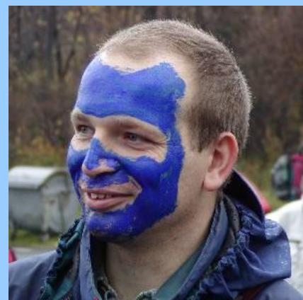
POSLEDNÍ SLANĚNÍ - Správné označení členů družstev bylo základem posledního slanění.