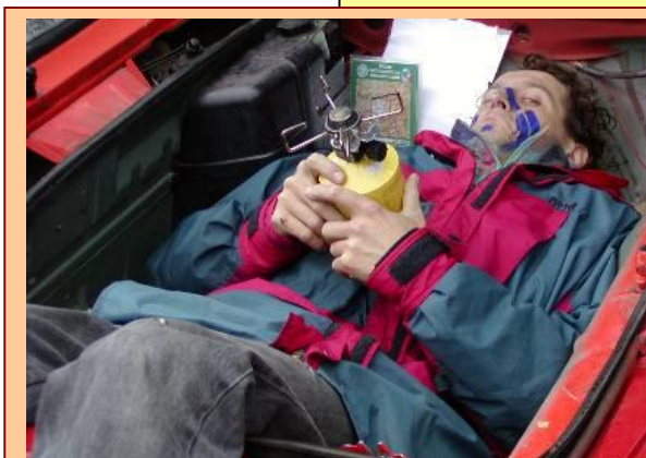
POSLEDNÍ SLANĚNÍ - Letoš s pochodní, vaříčem, v kufru Brořkovo škodovky.

a poslední úsek na výšinu Franze Josefa je to už zase do kopce. Vjíždíme do patrového parkoviště do prvního patra s vyhlídkou na náš kopec. Je 8 hodin ráno. Hned nám zkazil radost chladič, který málem explodoval a vyprázdnil svůj obsah