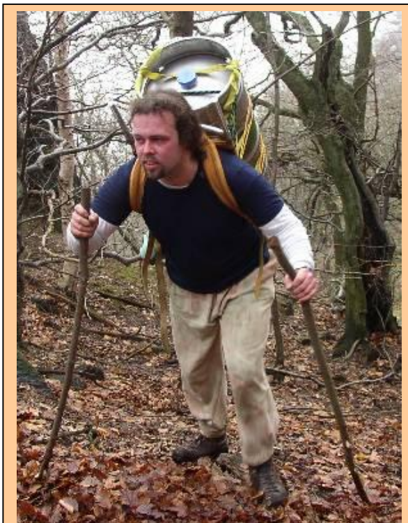
BALTAZAR CUP 2002 - Jedna skvělá super vynáška ...

hranu plotny kolem skob až na chodecký terén k nýtu. Leoš pak táhne předposlední délku v lehkém terénu pár metrů pod kříž. Já jsem koženej, a tak radši ještě na laně táhnu posledních 20 metrů ke kříži. Je 8.16 hod a jsme na vrcholu. Akorát odchází nějakí lezci, kteří přišli normálkou. Fotíme se, jíme a pijeme. Postupně dochází kvanta lidí normálkou na vrchol. Tak po krátké kochačce sestupujeme normálkou Nordost Grat -II dolů. Cestou se všemožně vyhýbáme turistům. Jsou na štanovacích tyčích nalepený jak vosy na bonbóně. Nakukujeme do Pallaviciniho žlabu. Je odtátý hodně