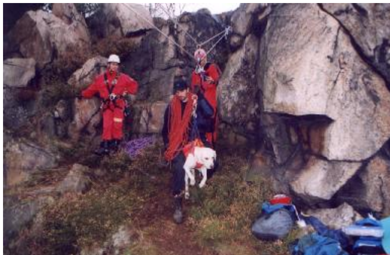
Podzimní metodika v Perštejně