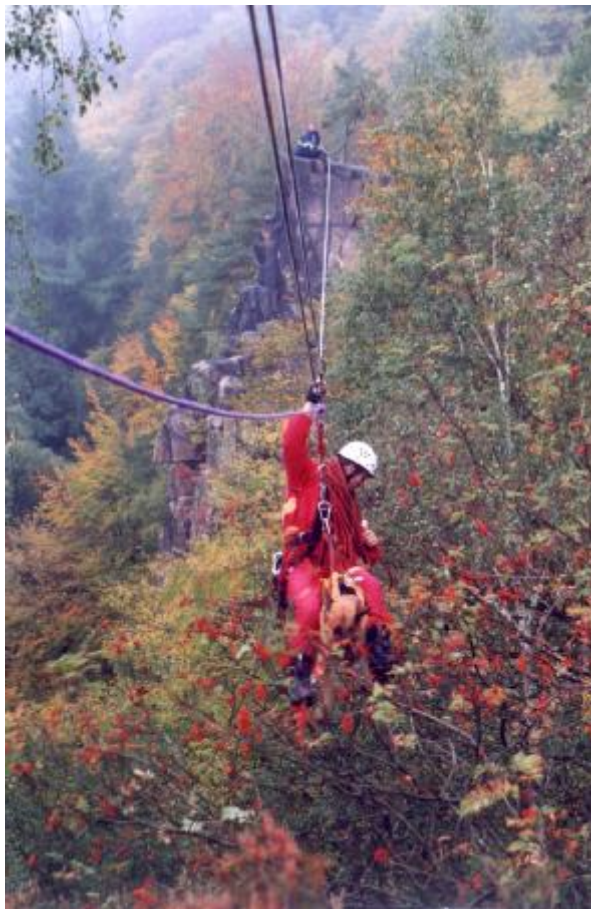
Podzimní metodika v Perštejně

Souběžně s nováčky prováděli výcvik hasiči-záchranáři. A jako netradiční hosté na metodickém dnu byla záchranářská skupina se psy. I na fotografiích je vidět, že psi, i když se museli světit do rukou svého pána při manipulacích ve 40m výšce, byli naprosto