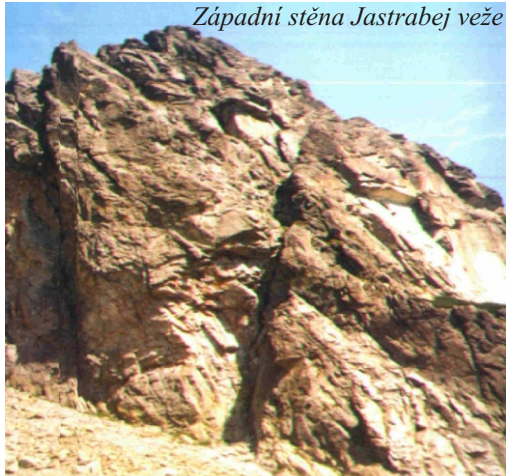
Západní stěna Jastrabey veže

Nějak to v nás za ty roky uzrálo. Dnes je nám směr výstupu jasný až na vrchol, chu do boje máme a víru v úspěch taky. Dokonce ani cáry mlhy plížící se do údolí ze severu nám vůbec nevadí. Navíc podle horolezecké hovnologie (viz Mantanu) je vše naprosto v pořádku, takže s chutí do toho. První dvě délky jsou moje číslo stejně jako před lety. Nástup plotnou asi 10 m po krásných kyzech je vzorkem toho, co vás čeká dvě délky nad převisama, pokud se tam dostanete. Pak začíná boj. Nejprve jsem se prásknul úplně vlevo do linie borháků. Stejně jako tehdy. Komplikovaně se přesouvám do středu převisu a kolem starých skob a fixního stopera odvlávám první převis. Je to vyložené pro dlouhání, kdy do dobrých madel musí prcek udržet nepřijemné stisky. Dokonce jsem se opřel o převis i hlavou, abych mohl přesáhnout. Nepříjemné zjištění je kapající voda v naší výstupové linii. Nad převisem se sunu doleva podél starých skob a další stříška mě nechce pustit. Zkousím to zprava a nic. To už je teda moc. Najednou se ve mě probudil zbytek lezecké inteligence a přímo středem na medvěda to pouští. To jsem ale ještě před tím stihl zašlehnout stopera v tenké spárce a díky tření jsem nedokázal cvaknout čistě kroužek nad převisem. Vracím se vycvaknout