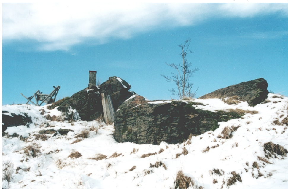
Z Drsoně 1. stupně

Akce se může zúčastnit kdokoli z mladých lezců Horoklubu, zároveň vítáme účast dospělých zkušených lezců.