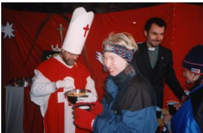
Jeskyně Českých bratří – Eliška u přijímání těla a krve horolezce...