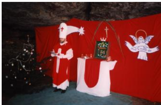
Jeskyně Českých bratří – doznívá krásná varhaní hudba, připravuje se „kárání hříšníků“...

Gregoriánské chorály a Toccata und Fuge d moll od J.S.Bacha přivítaly více jak 60 (!) účastníků horolezecké Vánoční mše v jeskyni Českých bratří. Ve vánočně vyzdobené jeskyni nechyběl oltář ani Betlém. Mše začala krátkou modlitbou „Ave Maria“ a po Orffově O Fortuna, byly přivítány všechny přítomné děti. Jednotlivé výstupy byly odděleny krásnou hudbou - po vzpomínce na zesnulé horolezce zaznělo např. Requiem od Wolfganga Amadea Mozarta. Možná je třeba zdůraznit, že se nejednalo o žádné parodování, či zsměšňování svatých mší. Hlavní smysl byl v tom, aby se lidé, kteří spolu celý rok lezou a tráví společně čas v přírodě, sešli i na Štědrý den, oslavili společně nejkrásnější svátky společně s dětmi a zazpívali si koledy uprostřed skal. Podle ohlasů můžeme říci, že se to povedlo a všem se tato netradiční akce z dílny Štěpán – Chára líbila. Pro ty z vás, kteří se nemohli mše zúčastnit, přinášíme krátký výťah toho, co zde odeznělo a pár fotografií.