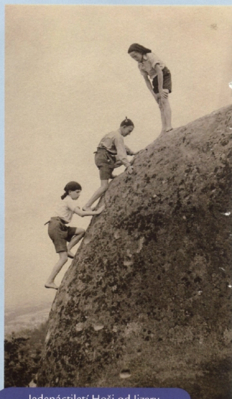
Jedenáctiletí Hoši od Jizery

Jejich první starostí bylo po vzoru Rychlých šípů obstarat si nějakou klubovnu. S nadšením přijali myšlenku, že si klubovnu postaví sami. Domnívali se, že budou schopni vybudovat z klacků a roští malou chýši v místě hrátek, kterému říkali Vrbičky. Docela intenzivně a pilně každé odpoledne po škole na