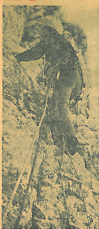
Výstup severní stěnou Šite

Po mokřém dni nás ráno budí chlad. Když zjišťujeme, že je jasno, okamžitě se rozhodujeme pro výstup cestou „Steber Šit“. Po hodině pokusu jsme pod prvními skobami. Nemohu se dost dobře rozhlédnout, kudy vede výstupová trasa, neboť skála je tak převislá, že vidíme maximálně na 10 m. K postupu slouží špatně držící skoby, zatlučené navíc na dos-